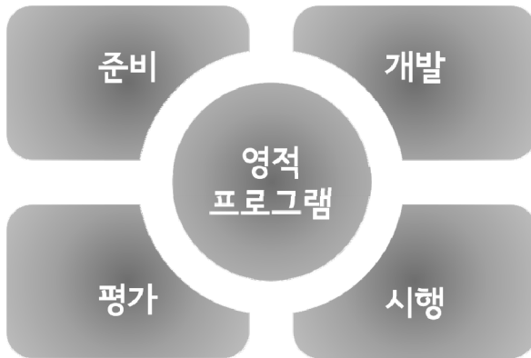
그림 2. 영적생활 프로그램을 위한 국면들

재림교 대학의 영적생활 프로그램은 최소한 4단계를 거친다: 준비, 개발, 실행, 평가(그림 2 참조). 그리고 각각의 단계는 다음 것들을 고려한다: 1) 우리는 누구이며, 이는 왜 중요한가? 2) 우리는 어디로 가는가? 3) 우리는 어떻게 거기에 도달하는가? 4) 우리는 어떤 영향을 끼쳤는가?