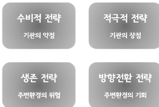
그림 5. SWOT 분석에 따른 전략

영적 마스터플랜은 SWOT 분석의 형태로 강점, 약점, 기회, 위협 (Strengths, Weaknesses, Opportunities, Threats)을 식별하고 기관의 영적 삶에 대한 평가로 시작된다. [부록 G의 예 참조]. 그런 다음 이 분석을 해당 전략 개발의 기초로 사용한다(그림 5 참조).